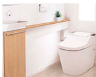
タンクレストイレ